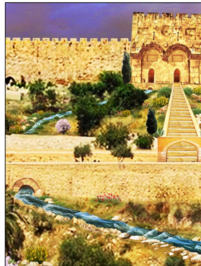
Aus der rechten Seite des Goldenen Tors (Osttor) fliesst ein Quellstrom lebendigen Wassers herab

In jenen Tagen wird der ganze Überrest Israels Yeschua als persönlichen Erlöser und Adonai (Herr) anerkennen und an Ihn glauben. So erfüllt sich die Aussage Yeschuas aus Johannes 7,38 auch sichtbar in Jerusalem. Lesen wir dazu auch die Prophetie aus Joel 4,18: “und aus dem Haus des Herrn wird eine Quelle hervorbrennen und das Tal Sittim (Arava-Senke in der das Tote Meer liegt) bewässern” .